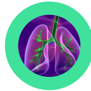
Enfermedad Pulmonar Obstructiva Crónica (EPOC)